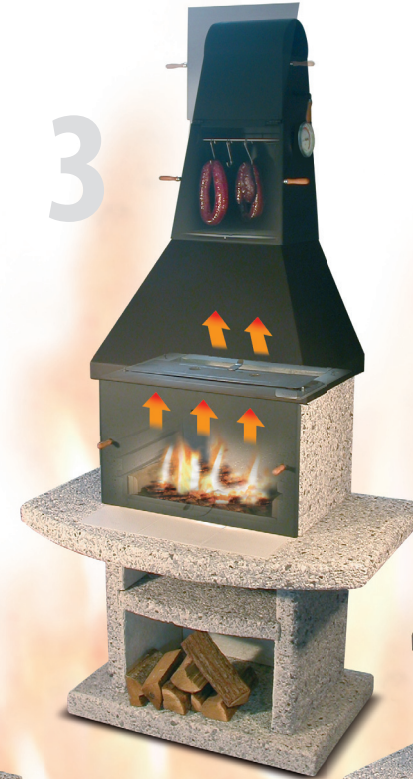
Uzení a douzování