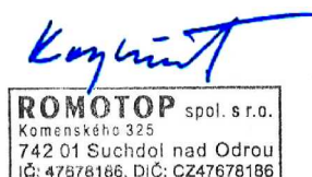
Ing. Vladimír Krajíček Produktní in inovativní vodja

Preberite in upoštevajte navodila za uporabo in za namestitvev! Predpisane varnostne razdalje in razdalje do gorljivih komponent je nujno potrebno upoštevati! Zadostna količina zraka mora biti dovedena do ognja v kaminu! Ogrevalne naprave s tehnologijo vode je dovoljeno zagnati le, ko vse varnostne naprave brezhibno delujejo!